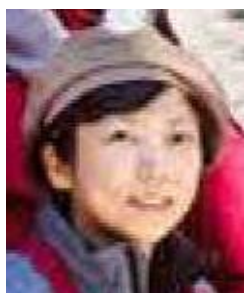
担当: 日配リーダー