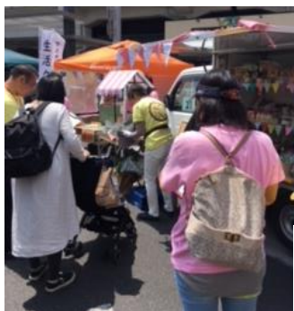
自転車の前に荷台、そしてチャイ販売！移動式！どこでも行けるぞ！