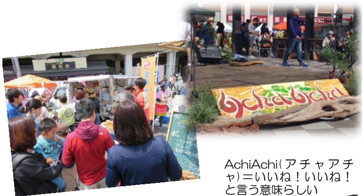
家族連れで大賑わい！