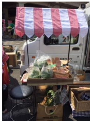
↑展説車でんじろうも飾り付け、ミニデポーっぽくなってきたぞ