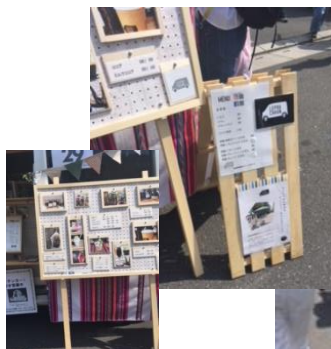
手作り感満載。木のあしらいが、おしゃれ