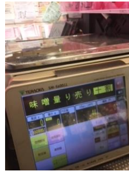
味噌や青果の量り売り

駅近、小さいと聞いていたのですが、想像とは、違う感じで、明るくて、入りやすい品揃えもよくて、見易かったです。 珍しい魚もあり、貝の殻も取るサービスもしてくれます。 赤貝買って、お弁当と一緒に食べました。醤油つけなくても美味しかった （いちご支部 O）