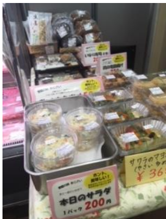
仕入れた惣菜、弁当

限られた空間にたくさんの見慣れた品々。店内手前にバレンタインのチョコ、奥には鮮魚が並んでいる。さばいているのは女性です。 デポーができると原材料名を見ないでいつでも安全なものを買えるという安心がある。同じ志の仲間が経営していると思うと気持ちも温かい。一日も早くデポーができるのを楽しみにしています。 （草加支部 I）