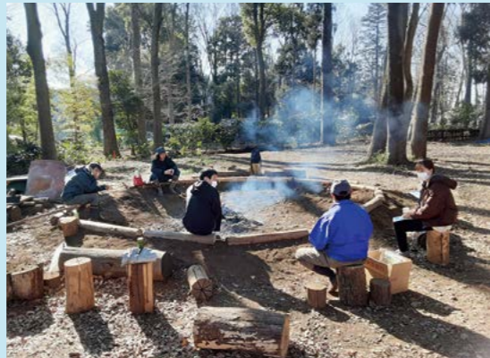
三富協同村でのキャリアチャレンジの様子

法政大学(東京都)の学生が生活協同組合について学んだり、キャリアについて考えたりする機会「キャリアチャレンジ」に生活クラブは協力しています。生活クラブ埼玉本部にも学生が訪れ、職員の仕事について学んでいます。