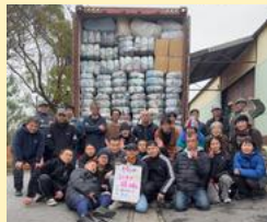
2026年2月・第96回 コンテナ送り出し ボランティアのみなさんと

年間130トンの衣類や毛布、バッグなどを回収してリユースしています。約90%はパキスタンの事業グループPJCと協力して海外に輸出し、販売した利益をカラチ市のスラムにある学校、アル・カイルアカデミーの運営費にします。約10%は国内でリユース販売して活動経費にします。