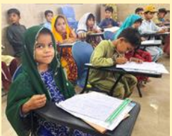
クラス分けのテストを受ける入学したばかりの子どもたち

スラムの子どもたちの自立を支えるために、1987年に始まった学校です。最初はたった1人の先生と10人の子どもたちでした。今では6500人の子どもたちが通い、320人の先生とスタッフが学びを支えています。スラムの子どもたちにとって学校は、学びの場として、また厳しい暮らしの中で友だちと一緒に過ごせる場として、大切な存在になっています。