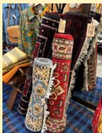
PJCから輸入しているパキスタンの物産など

JFSAとアル・カイルアカデミーのスタッフが行っていたリユース事業をさらにすすめるために、2020年に設立されました。今は9人のスタッフが働いています。JFSAが輸出したリユース品の販売に加え、パキスタンの物産や海外古着をJFSAが輸入する為の仕入れや買付をPJCが行ない、事業収益の一部を子どもたちの学びに役立てています。JFSAとPJCは常に協力して事業をすすめています。