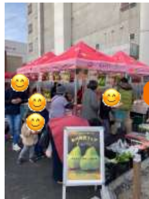
お魚釣りゲームコーナー

初日、山形庄内フェア生産者の登場にびっくり！山形大好きのお客さんと話が盛り上がる～