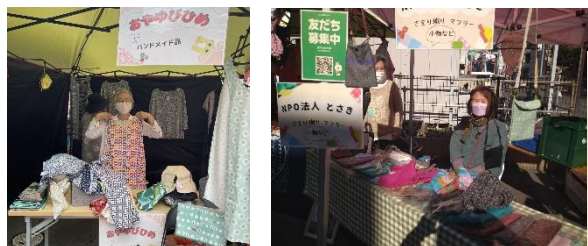
※写真は以前のわくわく市の様子