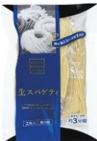
生スパゲッティ (2食入り) 税込238円

美味しい素材の旨みを生かす製法[無加熱製法]なので、コシが強く「もちもち」とした新食感、麺にはデュラム小麦本来の旨みがあります。ゆで時間は3分ほどなので、ソースと和えるだけで簡単に調理ができます！