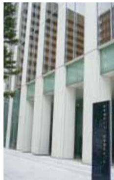
東銀座駅より徒歩3分 時事通信ホール