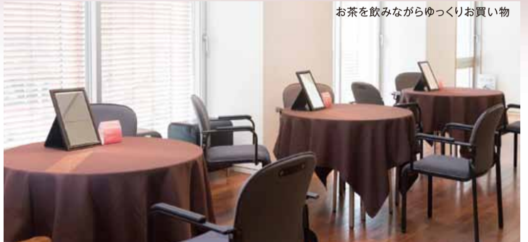
お茶を飲みながらゆっくりお買い物

今年も『東京真珠謝恩セール特別ご招待会』を銀座 時事通信ホールにて開催いたします。毎年多くの方にご来場いただいている大変人気の展示会です。広々とした会場には一万点以上のジュエリーを取り揃え、ゆっくりとご覧いただけます。また、価格は表示価格より30%OFF(一部除外品あり)と大変お買い得です。生活クラブの組合員でない方のご来場も可能ですのでお友達をお誘い合わせの上、ぜひご来場ください。