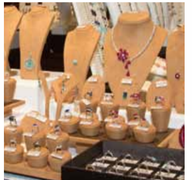
新作も多数展示しています