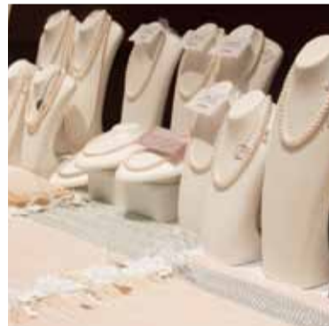
一万点以上の品揃え