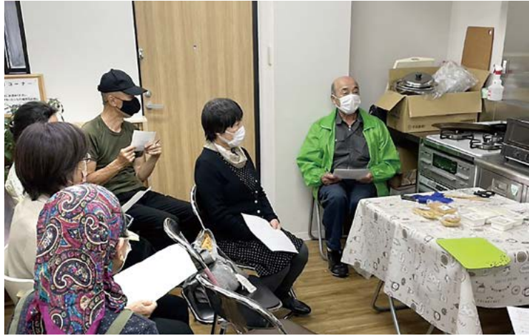
山下とうふ店の生産者交流会