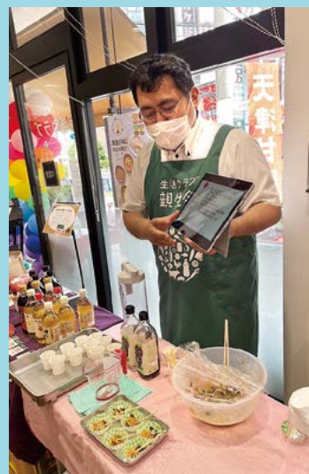
私市醸造の生産者交流会

味輝、プレス・オールターナティブ、コーミ、私市醸造、平田牧場、沃土会、藤原食品、王隠堂農園、小島米菓、日東珈琲、ヴィボン、ハイム化粧品、ミサワ食品、タイハイなどなど