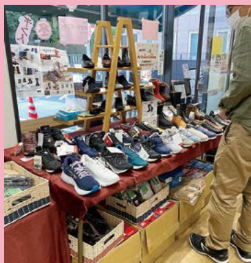
パラマウントの展示即売会

東京真珠、アイメイト、パラマウント、プラントイジヤパン、RHS、婦人服ファール、生活アートクラブ、デザインパンツイッチョ、アフロディーテ、根元泰蔵商店、蓼麻工房などなど