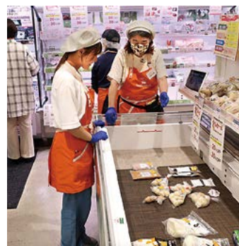
2023年8月13日取材 編集ワーカーズ・ふれあ