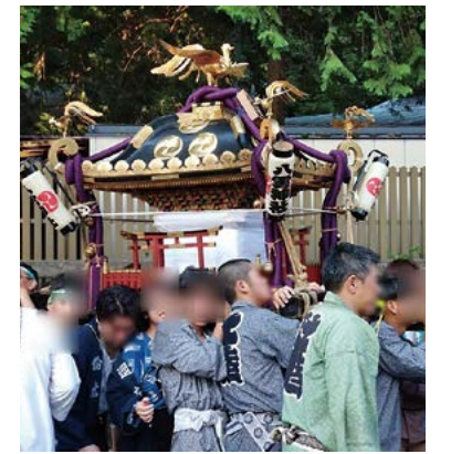
浦和まつりでの組合員による出店の様子